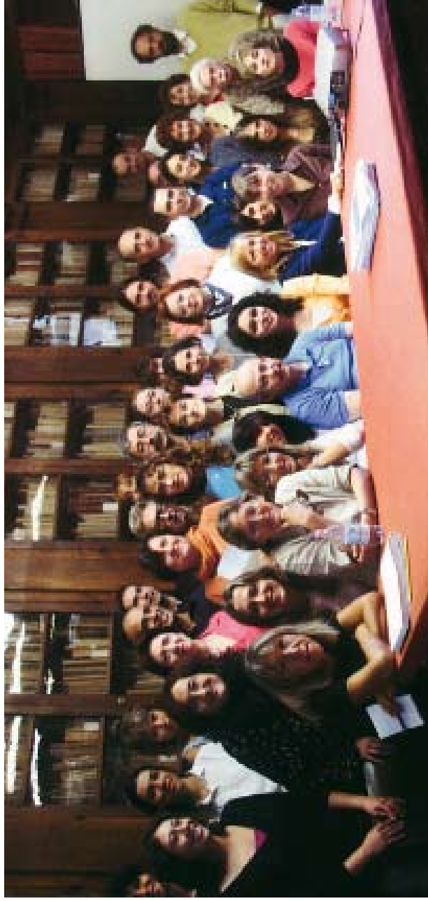
La redazione nel nuovo secolo.