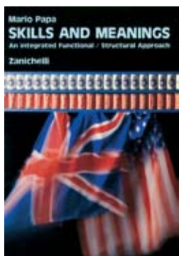
Mario Papa Skills and Meanings An Integrated Functional / Structural Approach 1986